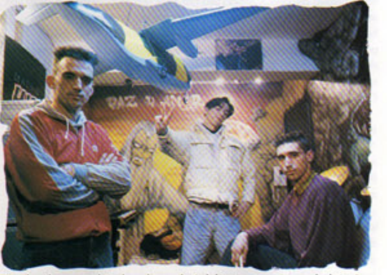
DNI. "El sonido me va conduciendo escaleras arriba. La habitación es pequeña, pero de alucinar".