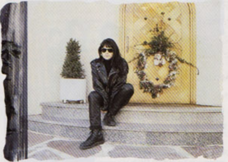
SWEET: "Por sacarlo en RDL, todo el mundo se enteró de a quién iba dirigida 'Te quiero de verdad'".